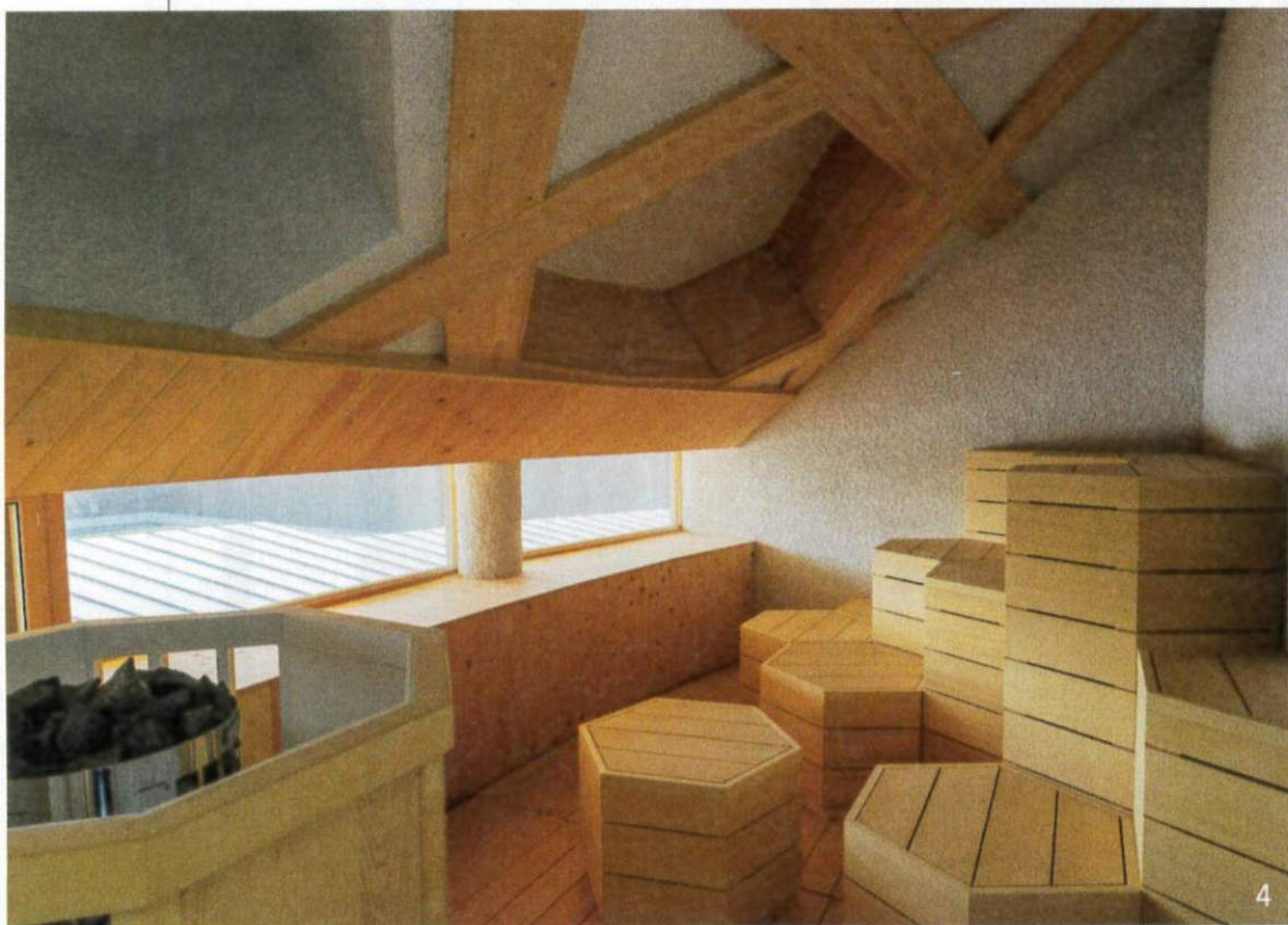
山形県鶴岡市北京田字下鳥ノ巣 23-1 ☎ 0235-25-7424