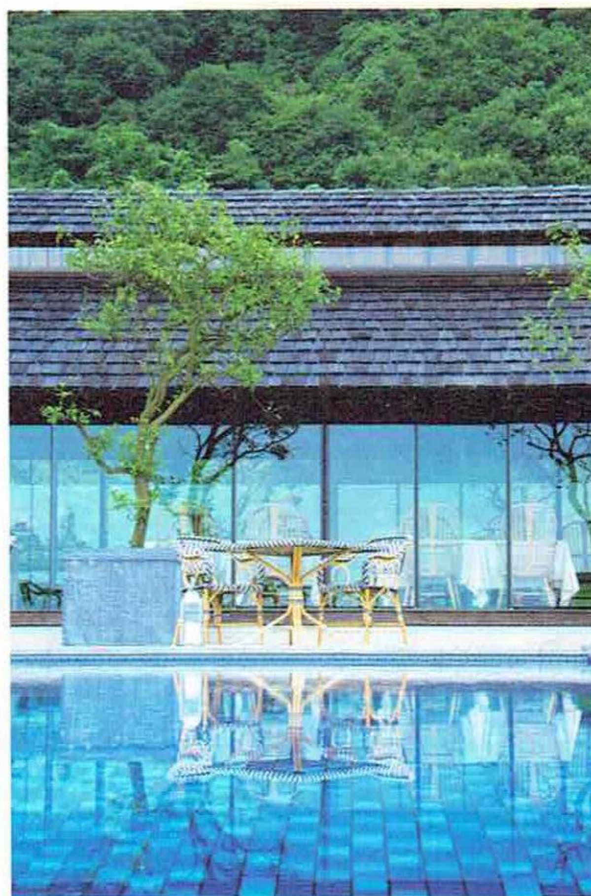
くつろぎのダイニングテラス Relaxing dining terrace