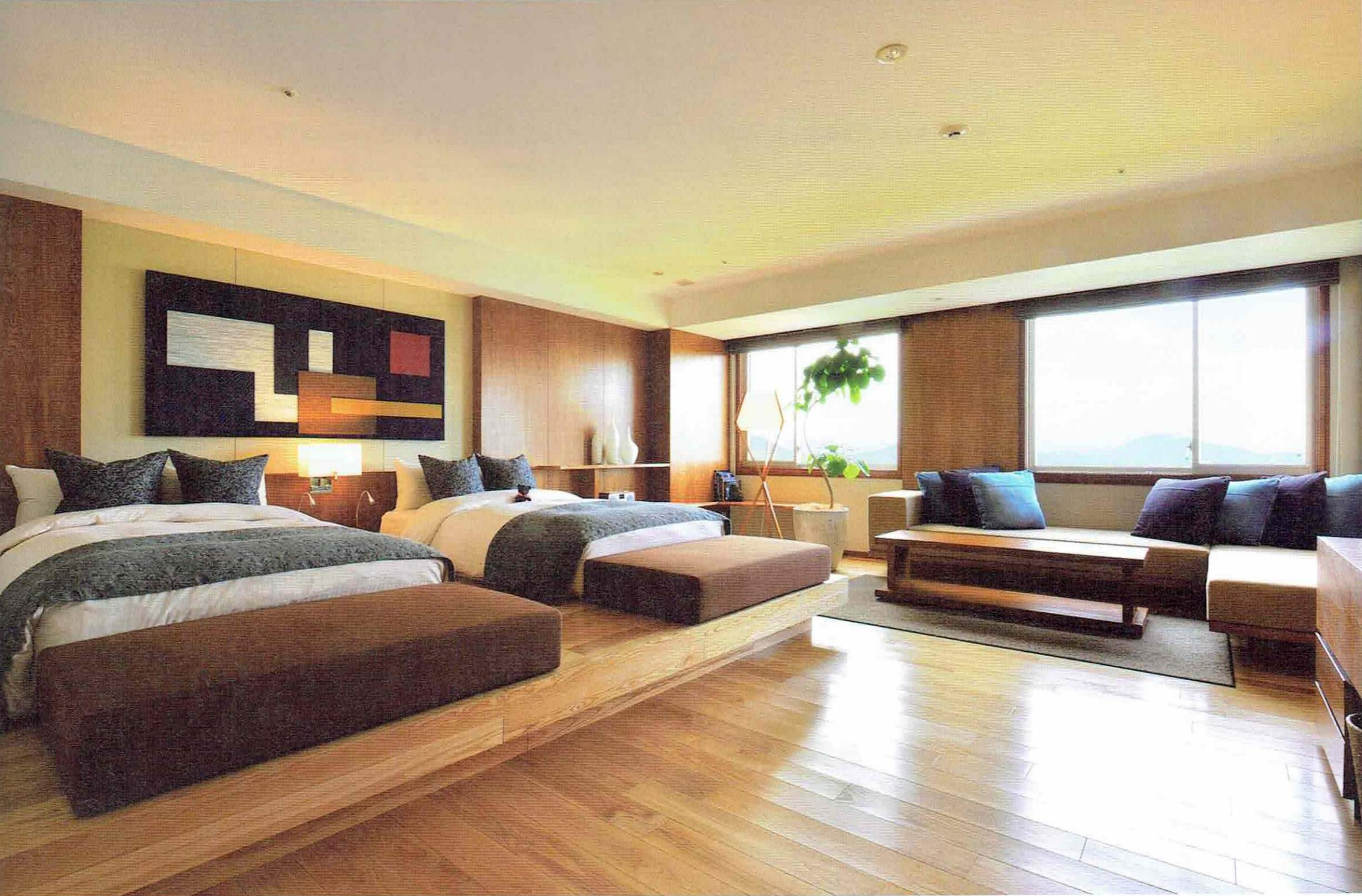
客室(ザ・ベラビスタ) Guest room(The Bella Vista)

designed by architect Takushi Nakamura. These services are provided with "Bella Vista Quality," backed