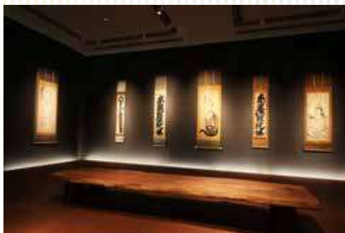
禪画や書など白隠の作品を展示する荘厳堂

視覚だけでなく聴覚や触覚までもが研ぎ澄まされ、自分自身が闇や光と溶け合って一体化していくような感覚に包まれます。静かな環境の中で瞑想し、物質と精神、有限と無限の境を取り払おうとする禅の世界と重なります。