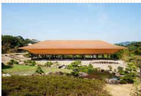
舟型のシルエットと白砂の庭が美しい洗庭

人間の心の内に見える光のようなものを意識した」と語っています。静寂の中、かすかな光の刺激に意識を集中させると、