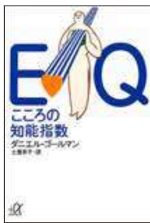
『EQ こころの知能指数』 (ダニエル・ゴールマン / 講談社+α文庫)

子どもが生まれてからはじっくり本を読む時間が持てず、読んでも育児本が教育本ばかりで…。時々来ていただいての幼児教育の先生からすすめられて読んだ数冊の教育本の中から、この一冊を紹介させていただきます。