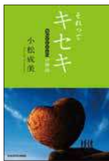
『それってキセキ GReeeeNの物語』 (小松成美 / KADOKAWA)

この本は、ノンフィクション作家の小松成美さんが、顔も名前も伏せて音楽活動をするGReeeeNの今までを4年をかけて取材し、小説として書き上げたもので、主人公が大阪にいた長男にすそめてくれた本です。