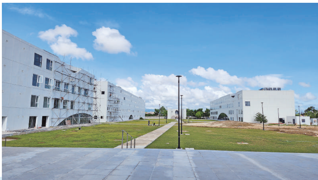
日本、韓国、中国、フィリピンの学生が交流するキャンパス