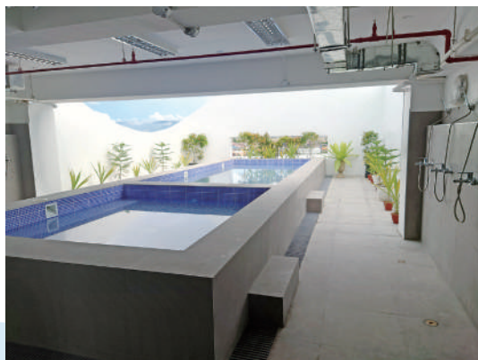
大浴場、露天風呂、サウナを備えた浴室（学生寮）